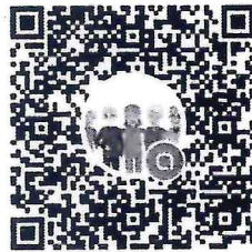
QR Code เข้าร่วมกลุ่มไลน์โอเพนแชท