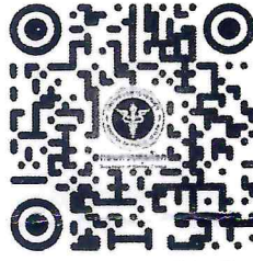
QR Code ลงทะเบียน